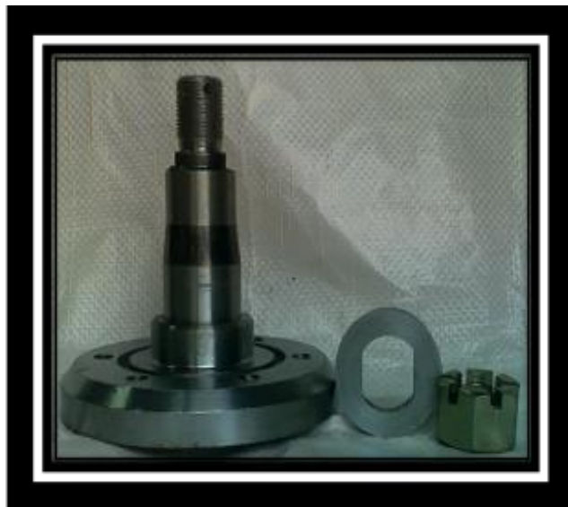
Ось режущего узла с (гайка+шайба)