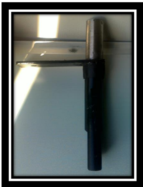
Стойка режущего узла в сборе